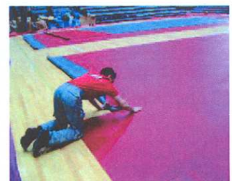
Installation du sol sportif Taraflex®