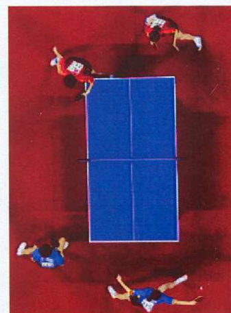
Fournisseur officiel des compétitions de Tennis de Table, Gerflor acheminera et posera 5.307 m 2 de Taraflex® Tennis de Table Portable® répartis sur 2 sites des JO de Pékin.

Acheminement des sols à Pékin en Janvier 2008