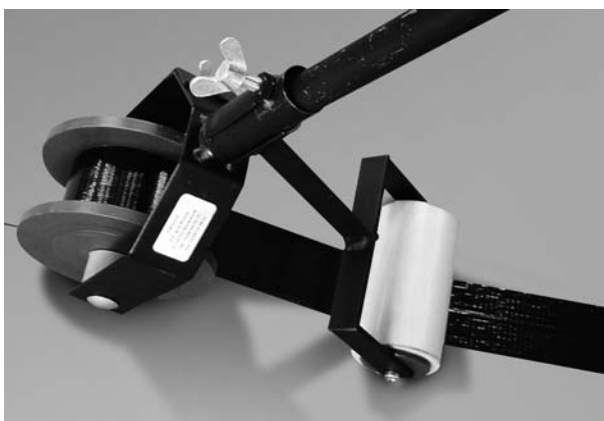
Dérouleur de bande simple face - H367 0003