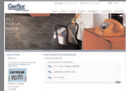
Espace presse dédié avec téléchargements

Gerflor conçoit, fabrique et commercialise des solutions innovantes, décoratives et éco-responsables, pour le sol et sa périphérie répondant aux besoins des marchés professionnels (santé, éducation, habitat social, commerces, bureaux, industrie, sport...) ou résidentiels, avec des collections créées en accord avec les tendances de la mode-maison.