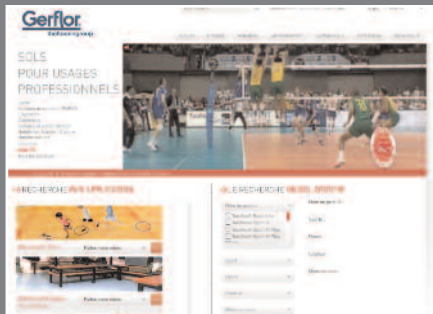
Animation vidéo en continu, rubrique Sports sur gerflor.fr