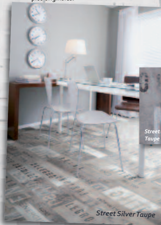
Street Silver Taupe

Plancha Silver revisite et détourne l'effet bois brut grâce à des joints imitation métal, pour un contraste saisissant et une touche de luxe des plus originales.