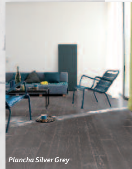
Plancha Silver Grey