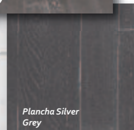
Plancha Silver Grey

Moove Silver, Typo Silver et Plancha Silver Grey : collection Primetex/Funtex, 9,90 euros le m 2 , disponible en rouleaux de 2 ou 4 m de large. Sanci Silver et Street Silver Taupe : collection Dance & Must, à partir de 7,90 le m 2 , disponible en rouleaux de 2 ou 4 m de large. Points de vente : grandes surfaces de bricolage et grandes surfaces spécialisées.